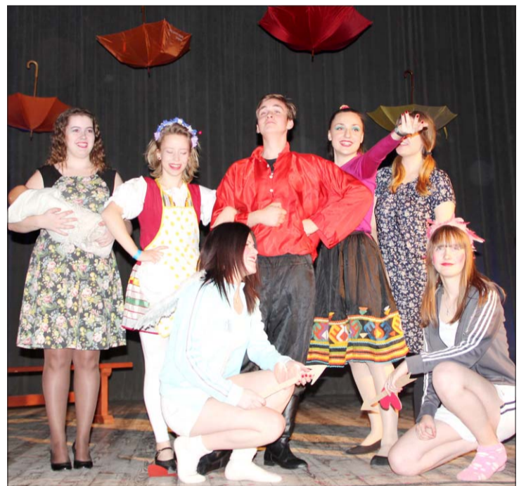
Pāvilostas jaunieši rādīja, kā mīl Krievijā. Viņu priekšnesums tika atzīts par labāko.