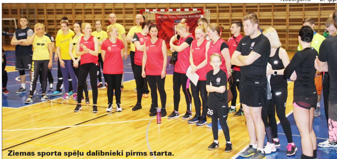
Ziemas sporta spēļu dalībnieki pirms starta.