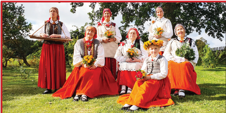
Saulaina, silta un notikumiem bagāta bija šī diena Nīcas etnogrāfiskajam kolektīvam.