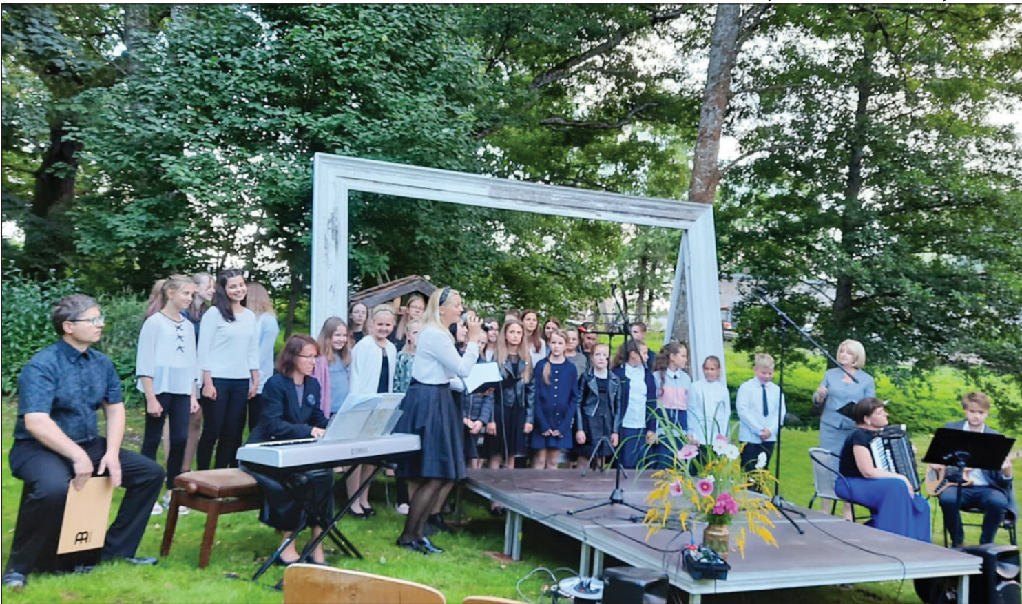
Nīcas Mūzikas skolas kolektīvs 2020. gadā.