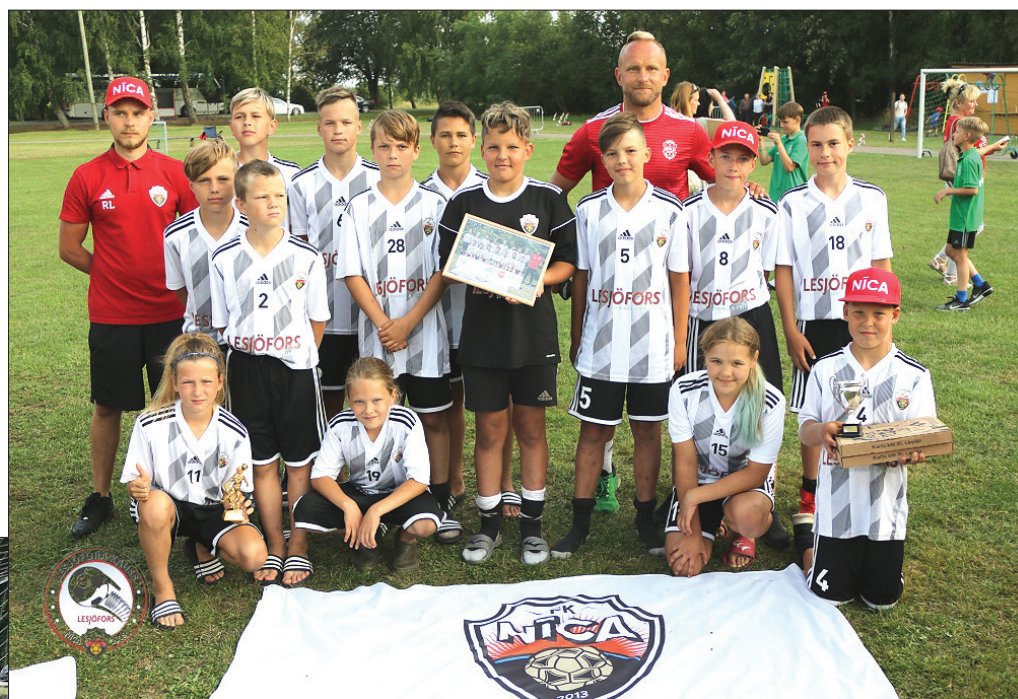
FK „Nica” U-12 grupas jaunieši.

Savukārt U-12 grupā pirmo reizi turnīra vēsturē visas godalgotās vietas izceļoja no valsts – 3. vieta FK „Gintaras” no Lietuvas, 2. vieta – FK „Baltika I” no Krievijas, bet uzvaras laurus plūca FK „Balta” no Lietuvas.