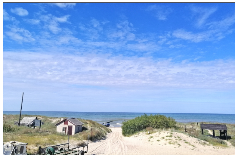
Skats uz jūru, no jaunizveidotās ekspozīciju telpas, skatu platformas.