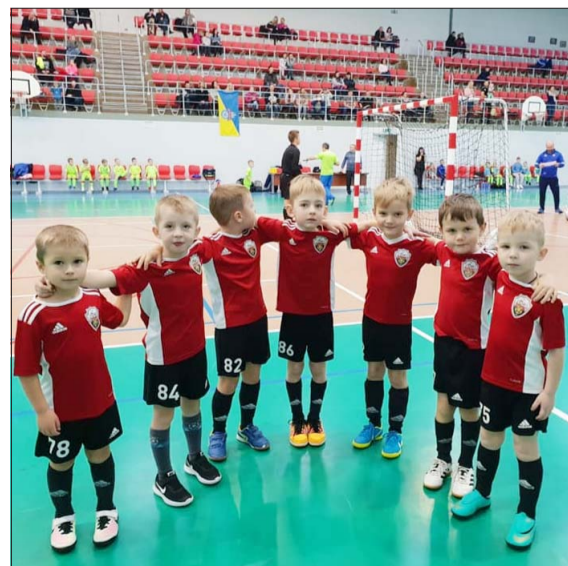
FK "Nica" jaunākie spēlētāji futbola festivālā Ventspilī.

Pieredzes bagātākajiem futbolistiem aizvadīti pirmie jaunatnes čempionāta posmi. Kā mūsējiem veicās, var izlasīt Nicas sporta halles facebook.com kontā un pašvaldības mājaslapā sports.nica.lv .