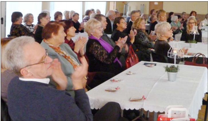
Šogad uz Ziemassvētku ieskaņas pasākumu bija pulcējies liels skaits novada senioru.

Mēs esam bagāti Ikreiz, kad svētki klāt, Jo varam savas sirdis Viens otram dāvināt.