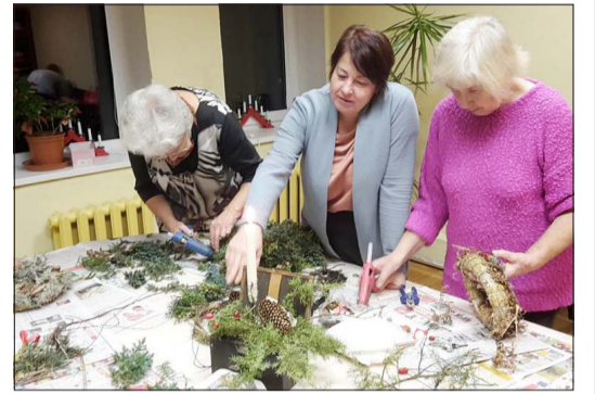
Otaņķos top Adventes vainagi.