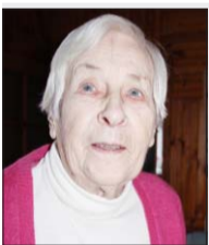
Guna Amerika ir nostaigājusi visus Nīcas un Otaņķu meliorētos laukus.