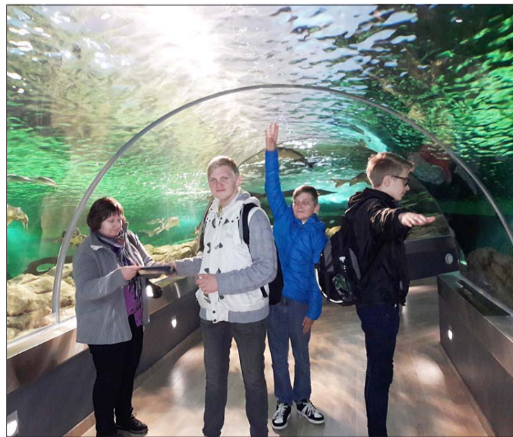
Ejoj pa tuneli ar caurredzamām sienām, varēja justies kā zemūdens pasaulē.