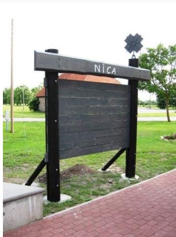
2.att. Stends pie Tūrisma informācijas centra Nīcā