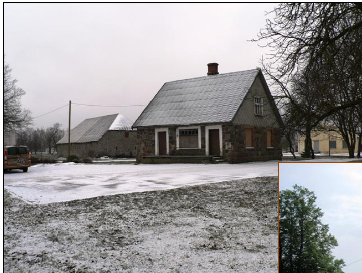
Attēlos: Ēka pirms un pēc rekonstrukcijas

Ziemā tiks izstrādāts visiem projekta partneriem (Nīcas un Rucavas novadi, Palangas pilsēta un Klaipēdas reģions) kopīgs informācijas buklets, kurš pavasarī tiks prezentēts tūrisma gadatirgos.