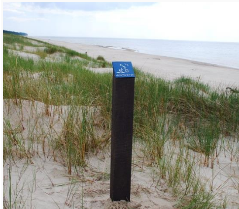
1.att. Velomaršruta norādes zīme piejūras kāpās

Šī aprīkojuma izgatavošanas un uzstādīšanas tiesības iepirkuma rezultātā ieguva IK „Gabaliņa Daiņa darbnīca” par kopējo izmaksu summu 8666,88 latiem.