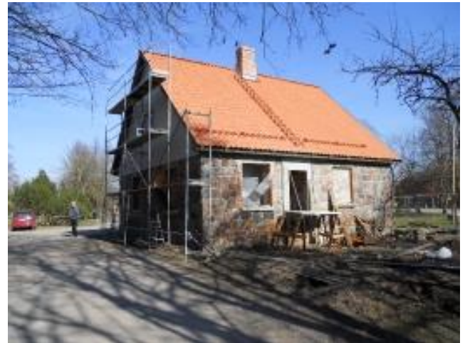
Constructed three short-term resting places in Rucava Reconstruction of Tourism information centre in Nica

In the next future will be prepared feasibility study of bicycle route infrastructure development, which aim is to develop the bicycle tourism infrastructure opportunities, selecting priority bicycle routes and promote recreation opportunities in the Baltic coastal region. Planning cycling route will connect these objects: Palanga Tourism information centre, Klaipeda District Tourism information centre, Rucava and Nica Tourism information centre. Bicycle route in the territory of Klaipeda district and Palanga Town municipalities will be combined with existing coastal bicycle route Klaipeda - Palanga - Šventoji.