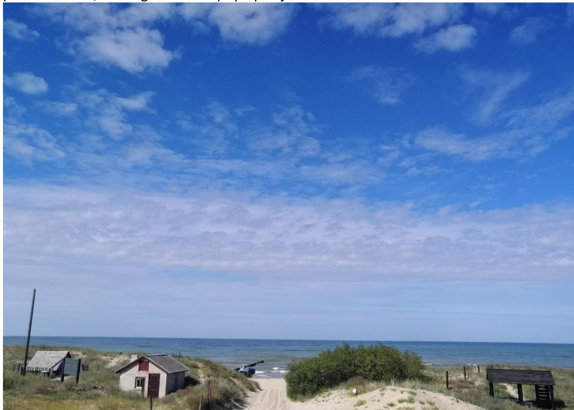
Skats uz jūru, no jaunizveidotās ekspozīciju telpas, skatu platformas